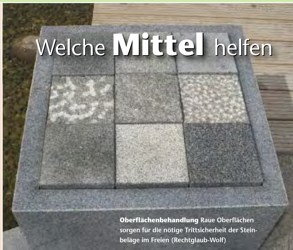
Oberflächenbehandlung Raue Oberflächen sorgen für die nötige Trittsicherheit der Steinbeläge im Freien

Wendlingen, www.lithofin.de , Tel. 070 24 / 94030; MÖLLER CHEMIE, 93346 Ihrlersstein , Tel. 09441 / 176940; NATURSTEINWERK RECHTGLAUB-WOLF, 23568 Lübeck , www.naturstein-zentrum.info , Tel. 0451 / 3700100