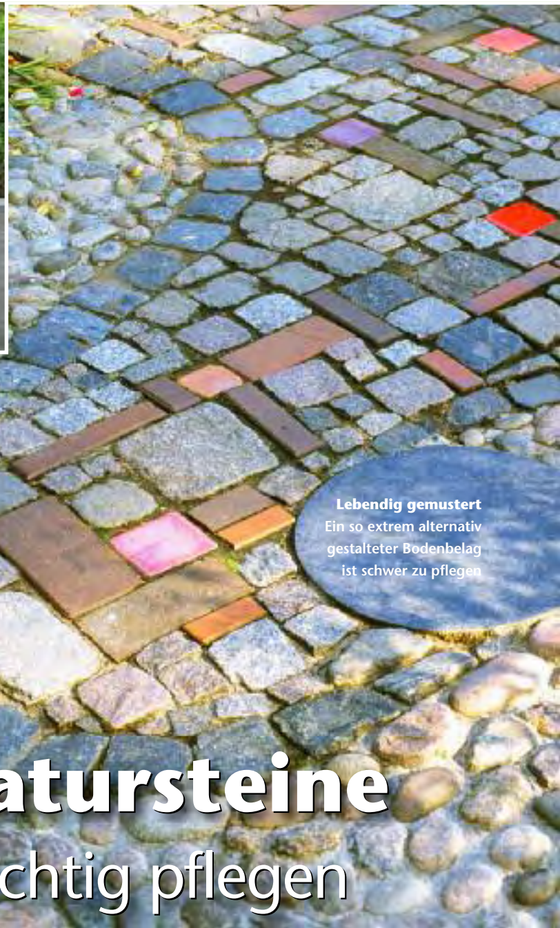
Lebendig gemustert Ein so extrem alternativ gestalteter Bodenbelag ist schwer zu pflegen