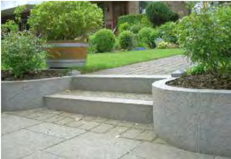
Fachmännisch verlegt Ein solider Unterbau mit guter Drainage erleichtert das Reinigen von Natursteinflächen

Damit man am Naturstein im Außenbereich lange Freude hat, muss er gepflegt werden. Wir erklären Ihnen, wie Verschmutzungen keine Chance mehr haben