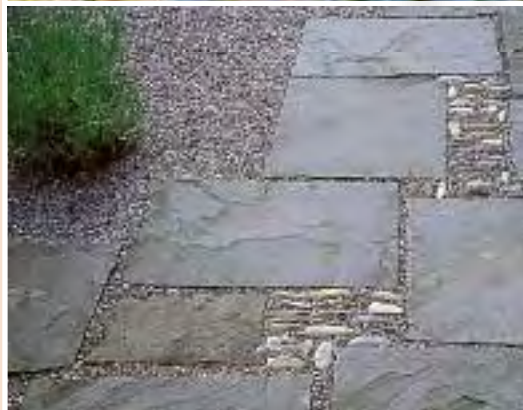
Schilfsandstein ist sehr empfindlich und für Wege eigentlich nicht zu empfehlen