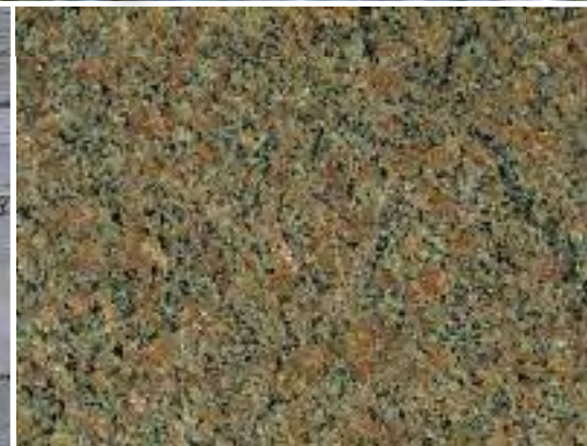
Bohus-Granit stammt aus Schweden. Mehr zum Hartgestein: www.bohus-granit.de